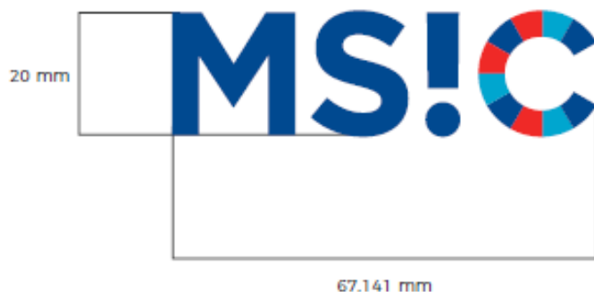
100% VELIKOST LOGOTYPU